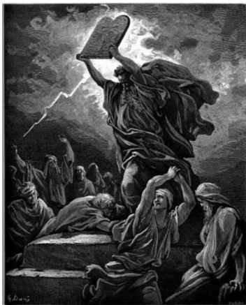
Мойсей на горі Сінай.