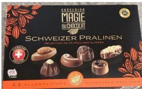
eine Schachtel Pralinen

Welche Geschenke kann man zum Geburtstag bekommen?