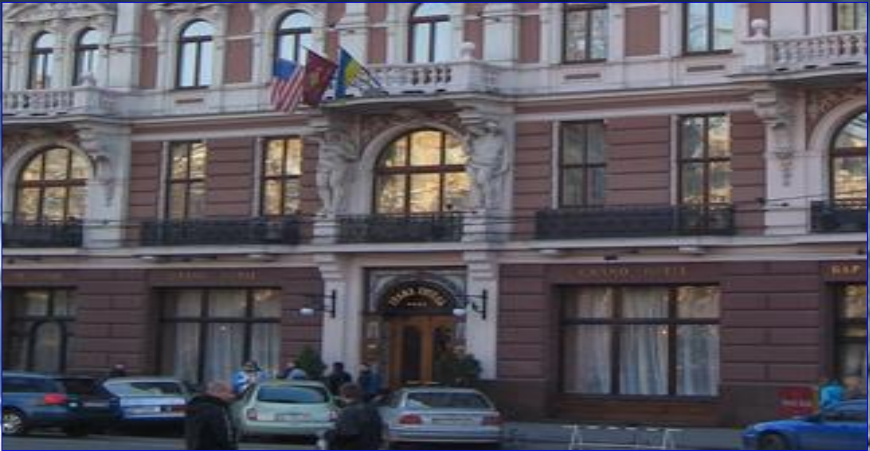
Силуети атлантів -«гранд Готель» пр. Свободи, 13, (архітектор Є.Герматник, скульптор Л.Марконі, 1893р.)