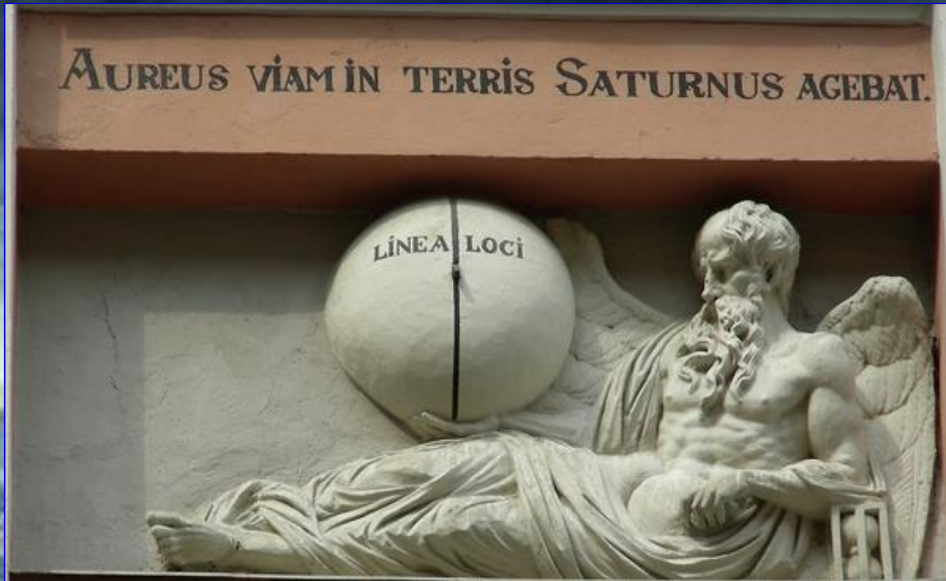
Бог Хронос у центрі фасаду будинку, що на вулиці Вірменській, 23 (скульптор Гартман Вітвер)