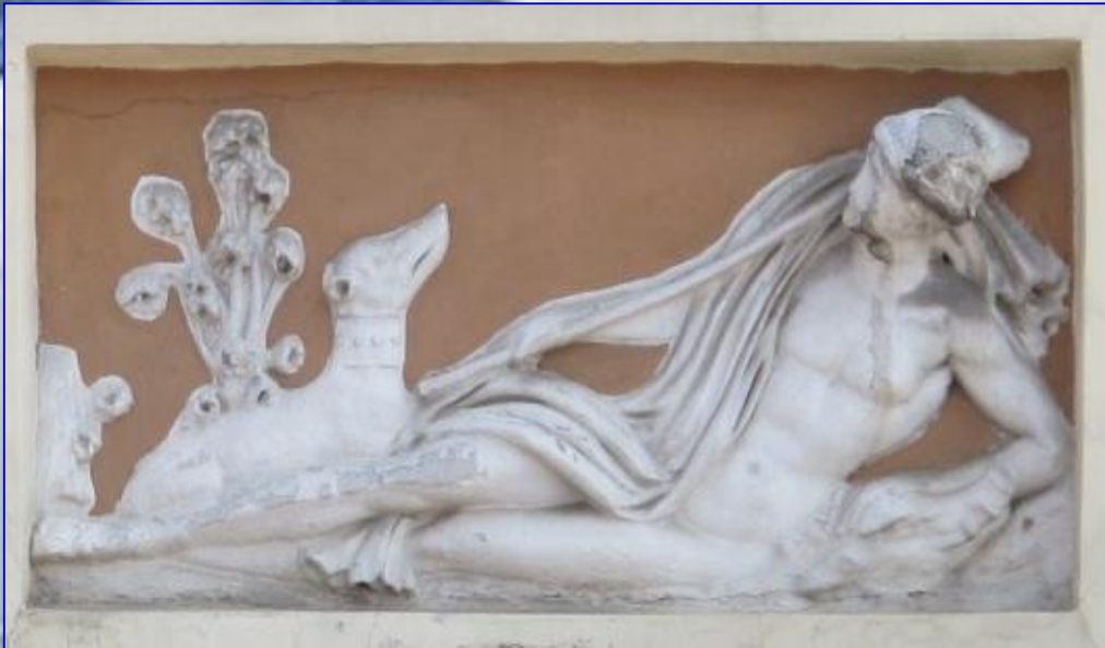
Артеміда з собакою