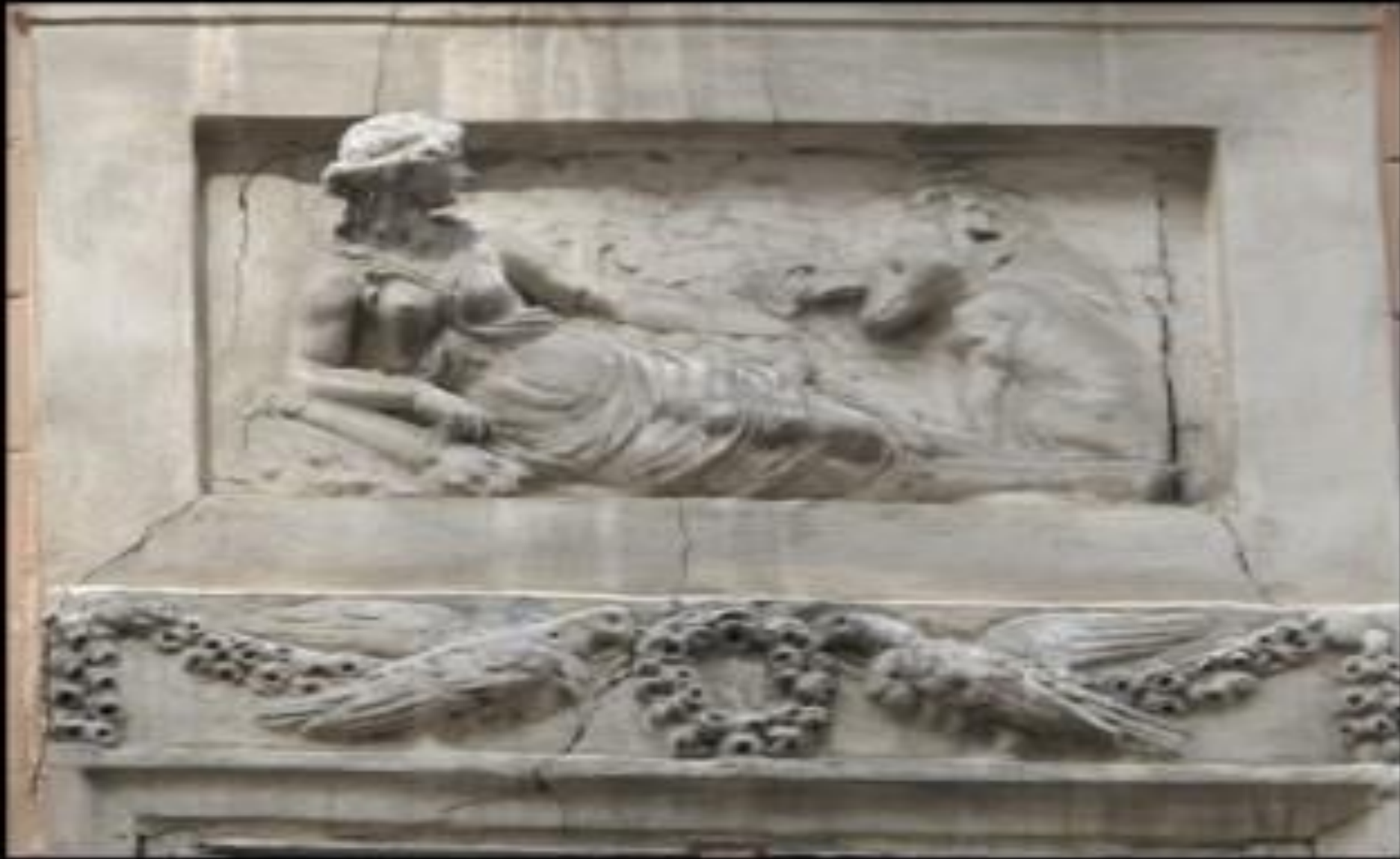
(скульптор Й. Шімзер, 1820 рік).